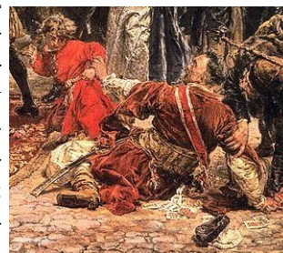
frag.. obrazu J. Matejki

kart wysypującą się z kieszeni Suchorzewskiego. To nawiązanie do sposobu, w jaki został on przekupiony przez rosyjskich wysłanników: otóż w pewnym momencie zaczął on ponoć wygrywać duże sumy w karty, choć