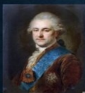
Stanisław August Poniatowski